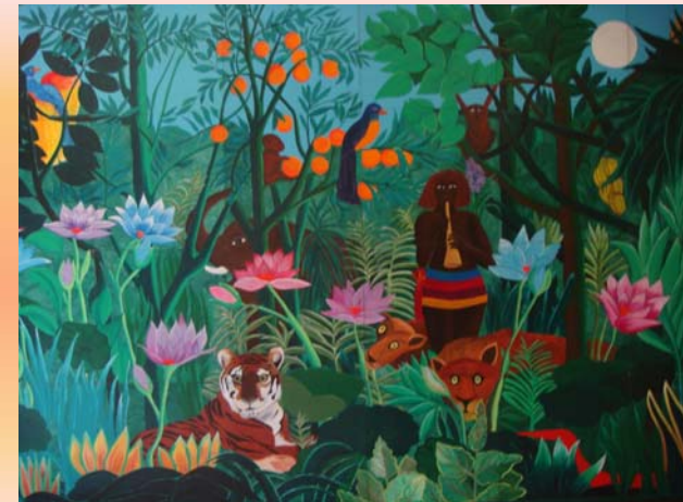
Pannello puzzle m 2.40 x 3,60

Da "Il sogno" di Henri Rousseau classe III A